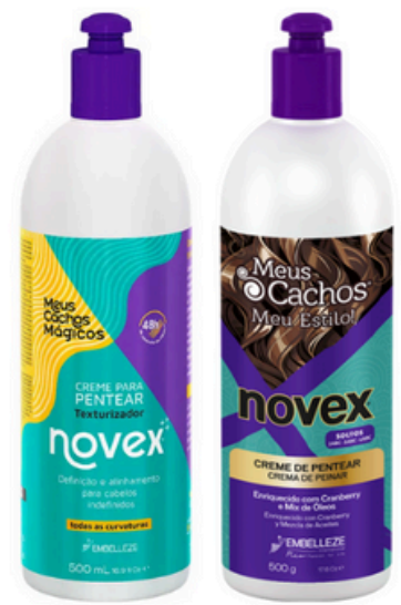
Diferente presentación mismo contenido

Meus Cachos Soltos Crema de Peinar permite que los rizos permanezcan profundamente hidratados, suaves, sueltos y con un brillo radiante. Contiene la fórmula de arándano, una poderosa fruta que tiene el efecto sorprendente Memorizador y protección solar al pelo. Ideal para te uras 2ABC-3ABC-4ABC