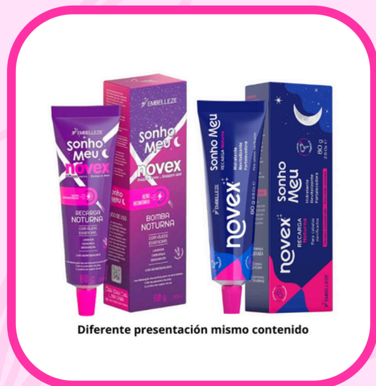
Diferente presentación mismo contenido

Restaura la nutrición y la belleza de tu cabello durante las horas de sueño, momento en el que los cabellos son más receptivos. Aporta Suavidad, Hidratación y Aporta Sedosidad al cabello sin aquella sensación de pesadez Para todo tipo de cabellos Con aceites esenciales de Camomila, Lavanda, Bergamota y Hemiesqualano.